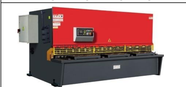
ГИЛЬОТИНА ПО МЕТАЛЛУ