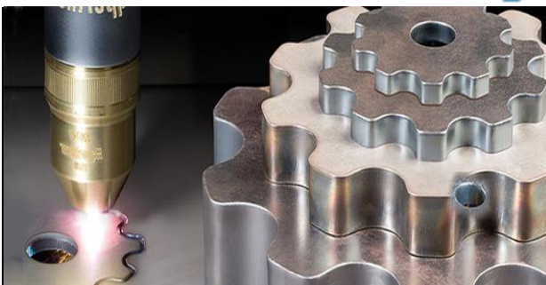
СТАНОК ПЛАЗМЕННОЙ РЕЗКИ